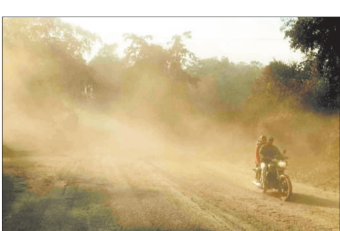
धूल के गुबार